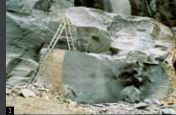
La parete di roccia è pronta per una nuova estrazione

5. Frèno : sistema frenante con pressione sulla cordina