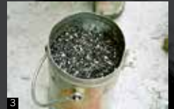
Pòra negra (polvere nera) e miccia (filo rosso)