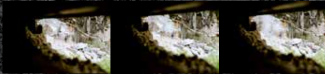
Immagini successive di una mina per ottenere lo sbancamento

Il brillamento delle mine presuppone l'esecuzione degli appositi fori nei quali viene poi inserita la polvere nera ( Pòra negra ). Mediante una miccia (vedi) ed un detonatore (attualmente a innesto elettrico) si effettua il brillamento..