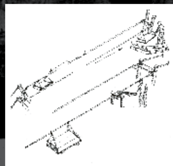
Gru e teleferica frenata, detta frèno (disegni di Armando Buzzini)